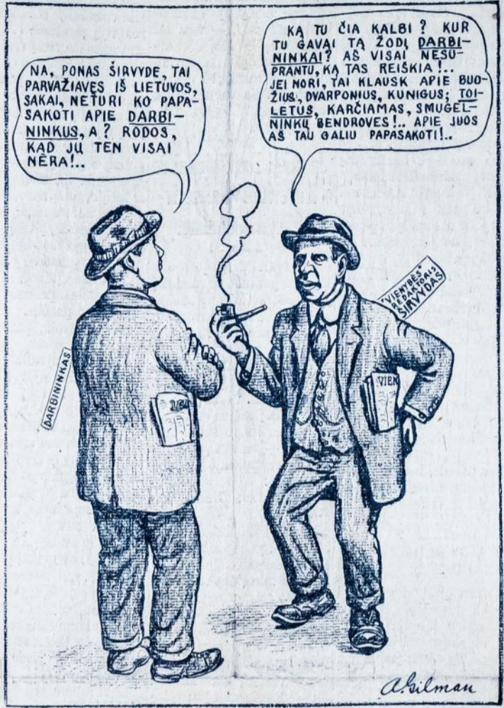
Sugrįžęs iš Lietuvos tautininkų vadas širvydas vyriausia savo įspūdių tema stotasi kumpius, sūrius, alutį ir toiletus...

KAUNAS.—Kelinta diena prie Francūzų emigracijos biuro (bene Laisvės Alejoj No. 61) stovi žmonių minia ir laukia... Paklausi, ko laukia, atsako: ugi važiuojam į Francūziją duonos įsigyti... Daugiausia vyrų, bet yra nemaža ir moterų.