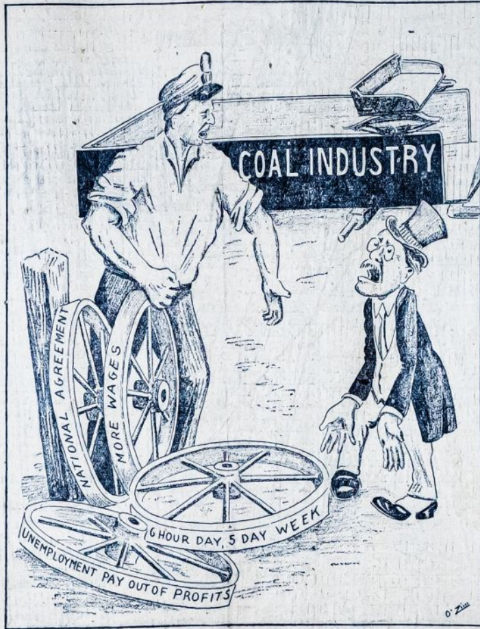
Neįpildžius kapitalistams darbininkų reikalavimų, sustojo mainų industrija ir mainieriai nedės ant jos ašių tekinių tol, kol nebus išpildyta jų reikalavimai, pažymėti ant tekinių.

Dalykas baisiai rimtas; dalykas skubus; dalykas neatidėliotinas. "Laisvei" reikalinga tuojautinė ir greičiausia pagelba delei bylos su kun. Petkum.