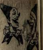
Kodėl tu esi Neapavėti?

Kreštovo salos gatvės turės įvairaus sporto vardus: Futbolo gatvė, Tėmiso gatvė, Gimnastikos gatvė ir kt.