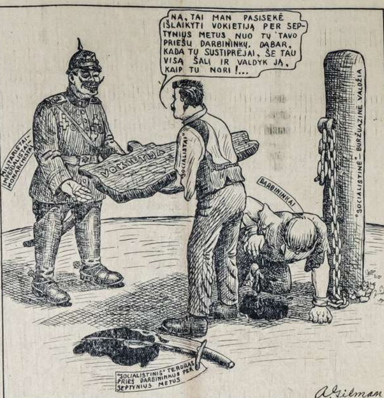
Vokietijos socialistai kovoją prieš komunistus ir kitus revoliucinius darbininkus ir plostė monarchistus (kaizerininkus), garbino jų generolą Hindenburgą ir laipsniškai privedė prie to, kad tapo išrinktas Vokietijos prezidentu kaizerinis buldogas Hindenburgas.