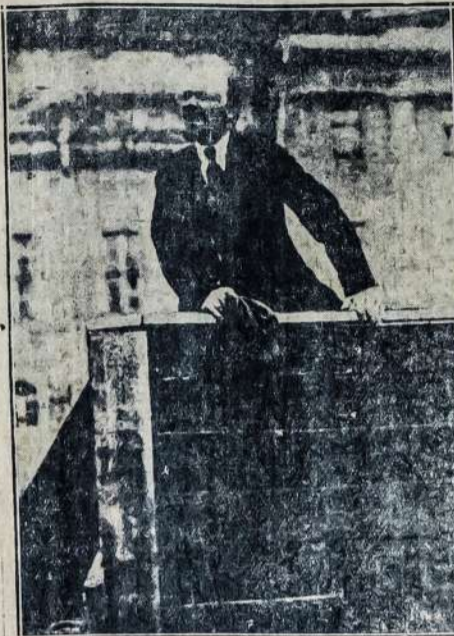
N. Leninas-Uljanov Sako Prakalbą.

Dabar prieš juos sukilo tie, kurie padėjo senąją valdžią nuverst — taip pat klerininkai.