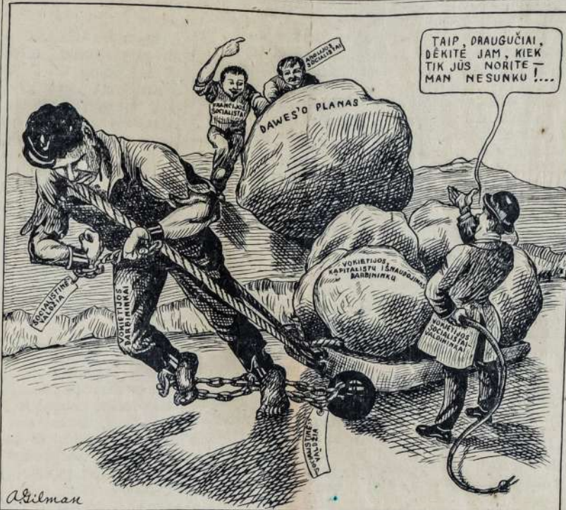
Talkininkų konferencij: Londone priėmė taip vadinamąjį Dawes'o planą lupimui karinių kontribucijų iš Vokiečių liaudies. Vokietijos socialistai valdininkai pritaria šiam planui, tik komunistai kovoja prieš jį.

toms spėkoms dalyvauti rugsėjo 12 d. karinėse demonstracijose. Girdi, parodvime pasauliui, jog Amerikos ginklai gali ištaškyti armijas visų kitų valstybių, jei tiktai mes panorėtu. O tame pačiame pareiškime ir tuo pačiu išsižiojimu p. Smith'as įsako visiems New Yorko valstijos žmonėms užpildyti bažnyčias ir melstis prie krikščioniško dievo, kad svetli duotu ramybę ir taika. Gub. Smith'as yra geras katalikas, todėl jis žino, ką myli durniai ir dievas: "Kariauk ir melskis!"