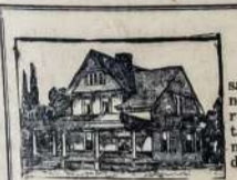
J. VASTUNAS Real Estate Co., 138 Union Ave., Telephone Stagg 5925.