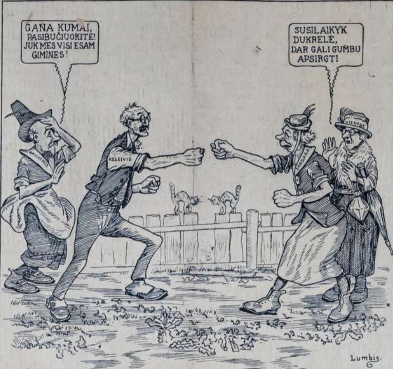
"Keleivius" varo šeimyniškus vaidus su tautininkų "Sandara", "Naujienu", Grigomėševikų "gazieta", ir "Vienybė", tautiškų davatuk kumutė, liepia "Sandarai" susitaikyti su "Keleiviu" Mat, visi keturi yra nariai tos pačios tautininkų "socialistinės" šeimynos.

Dabartiniai smalviriai SLA yra panašūs į bagočinius elementus. Chicagoj jurgejoniniai prasmirdė chinišku aliejum ir kujolais. Jie turi didesles gerkles ir yra dideli nachalai.