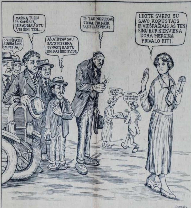
Rochesterio, N. Y., parapijos jaunikių verksmas ir dantų griežimas.—Bet ne vien Rochesterio parapijonai rauda, gailisi ir keikia, kuomet iš jų tarpo pasitraukia kokias protingesnės mergina ar moteris ir ateina į susipratusių, kovojančių darbininkų būrį. Kitose kolonijose dedasi tas pat.

Kodel negirdėt tokių vaidinimų Amerikoje? Matomai, visos nelaimingos dušėlės ir kiti špukai susikraustė į "šventąją" kunigininias nesiliaujas, nors