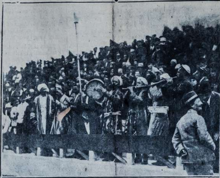
Turkestane apvaikšiojimas 6 metų sukaktuvių Rusijos Sovietų valdžios.

Tuscon, Ariz. — Arizonos Universiteto sekretorius A. O. Neal sūrinko faktų, jog vidurinėse ir augštosiose mokyklose merginos mokslu pralenkia vyrus. Jis atranda, kad iki 25 metų amžiaus merginos ir moterys apskritai turi daugiau protinio gabumo už to paties amžiaus vyrus. Bet po 25 metų tai, girdi, vyrai mažu-