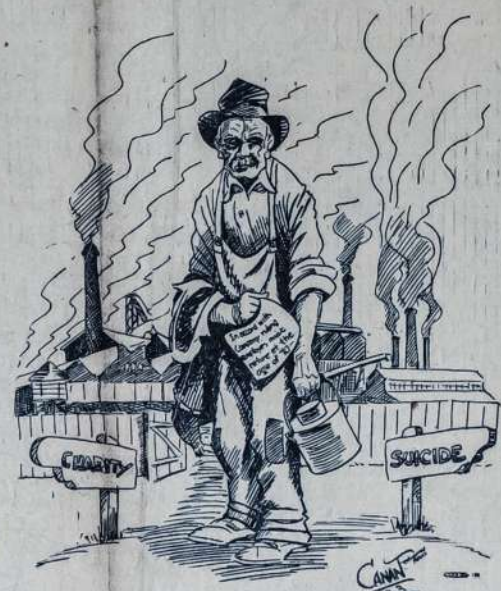
Nusenusias arba nepajęgiamiam, kaip reikalaujama, dirbti darbininkui kapitalistinėj tvarkoj lieka du keliai — buržuazinė labdarybė bei sūzudystė.