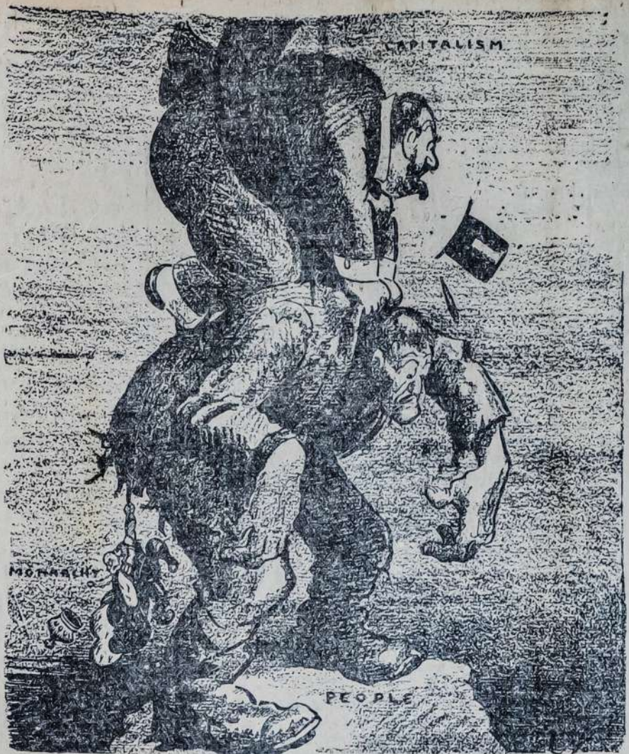
Vakarų Europos dirbančiai liaudžiai vis dar užsikorę ant sprando kapitalistai, o iš užpakalio į trukstančius skvermus kimba monarchistai. Bet atrodo, kad greitai laiku Europos darbo žmonių nusikratys tų sivebėlių ir prispaudėjų.