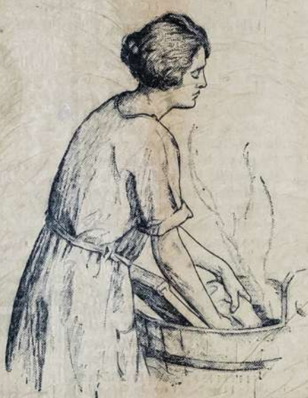
Budavo rankos pavargsta ir nugara paskausta begrundant —