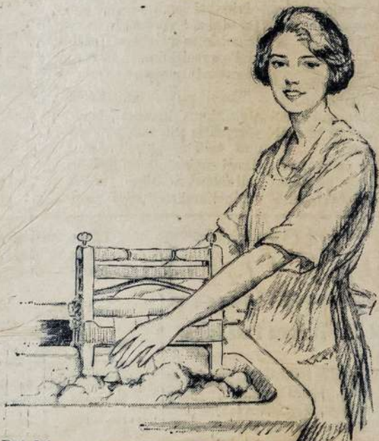
Bet dabar — išmirkius skalbinius vien tik perdedi juos į cystą vandenį del išskalavimo.