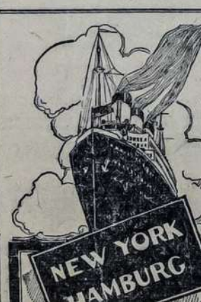
NEW YORK HAMBURG