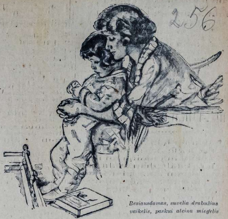
Besiausdamas, suvelia drabužius vaikeli, paskui ateina miegotis