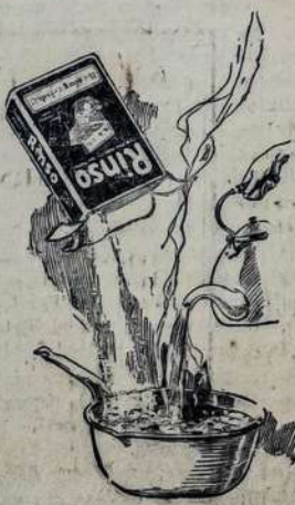
Vartok Rinso, kad padaryt putota, galy vandeni, kars atliuosuoja visą purvą nuo skalbinių.

Nusipirk šiaudieno skalbimo kilei, gromėjų arba departmentų. Jis pardavinėjamas dviejokio dydžio: paprasto dydžio ir didelio, naujame pake (dėžutėje). Lever Bros. Co., 164 Broadway, Cambridge, Mass.