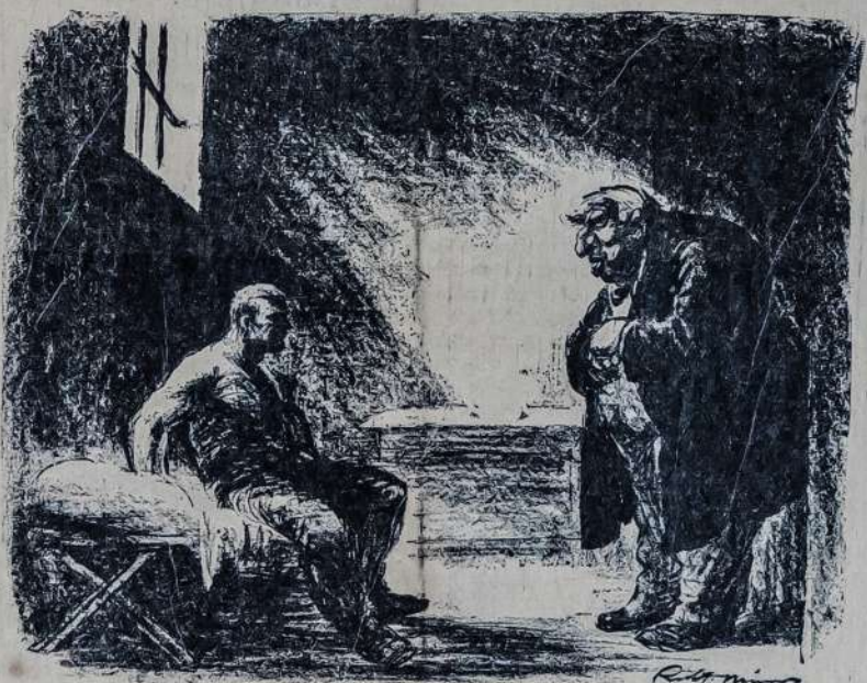
Prezidentas Hardingas vėl iškeliauja į šiltąją Floridą "pasilieči" ir kaulaite (golfa) pamušti; bet politinius kalinius, darbininkų kovotojus, paliko ir toliau "išsėtis" ir pelyti kalėjimuose.