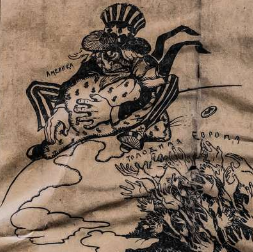
Amerikos kapitalistai sedi ant auksu maišu, o Europos darbininkai badmiriauja arba badauja. Kapitalistinė Amerika apkratė kišenių visam pasauliui, ir sprin gsta auksu.