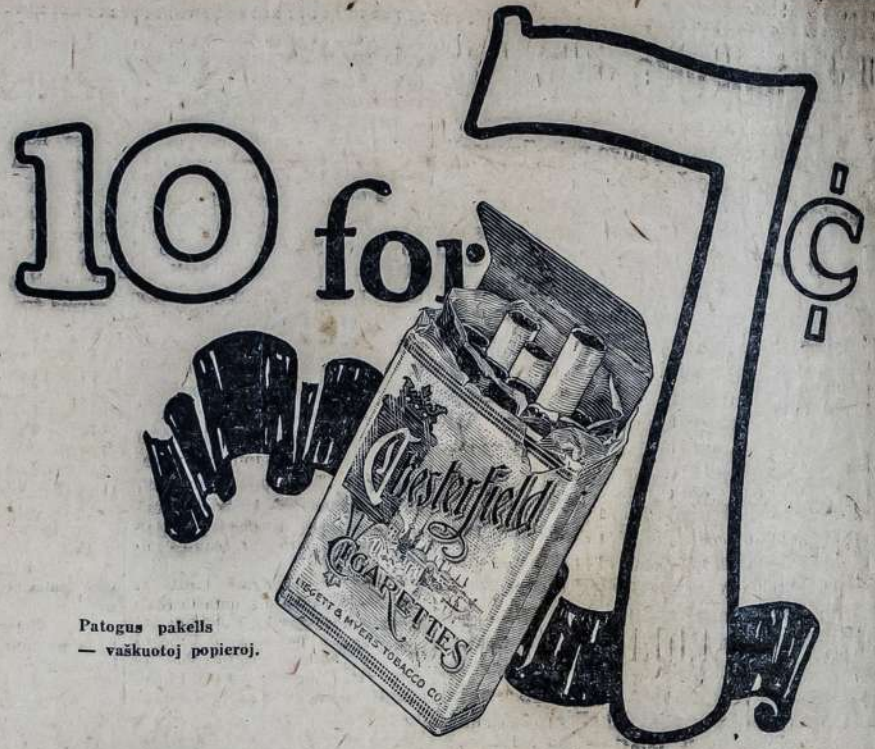
Patogus pakelis — vaškuotoj popieroj.