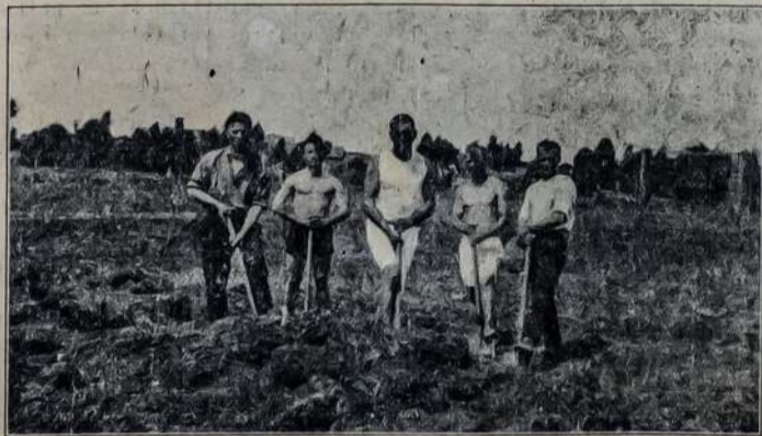
Kuzbaso Rajonon Nuvažiauv Darbininkai Kasa Pamatus Savo Busimiems Namams.

densko ir Bogoslavsko išdirbystėms. Kada Kuzneco industrijos dar labiau pakils, jo produktai keliaus į rytus Ket-Kas kanalu, kuris jungia Jenisėi upės centralinio Sibiro sistema su Ob upės sistema. 1921 metų nusisekusi ekspedicija per Kara maris pasiekti upes Ob ir Jenisėi atidarė vandens kelią, kuriuomi bus galima bėgiu 20 dienų Kuznecui susisiekti su visu pasauliu ir transportuoti savo produktus pasauliu. Žinoma, tai bus galima vien liepos ir rugpjūčio mėnesių laike.