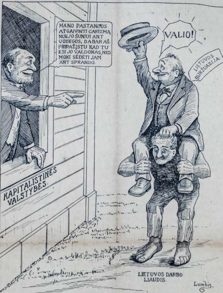
Štai kas džiaugiasi Lietuvos pripažinimu.

Toliau, Trockis sakė: "Niekad dar Europa nebuvo toks kratiny, kaip dabar. Kaip atskiri politikai, taip ir ištisos šalys, neturi jokio tikro plano; jie nežino, ką gali jiems atnešti rytojūs." Sovietų Rusija nenori kary; bet jeigu "Prancuzija su ginklu užgultų Vokietiją, tuomet Lenkija veikiausia