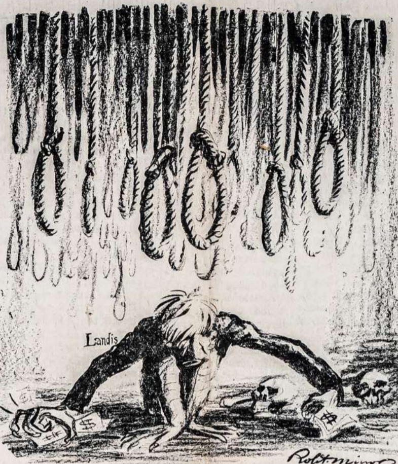
Rengimas Kilpų Darbininkams ir Saugojimas Kapitalo Nepaliečiamybės Tai Kapitalistinių Teisėjų Pareiga.

Columbus, Ohio. birž. 11.— Temperatūra buvo pakilus iki 92 laipsnių, bet ji puola. Iš gyvasčių nieks nenukentėjo. Prie Kanados rubėžiaus gana "šalta". Temperatūra pasiekia tik nuo 46 iki 71 laipsnių.