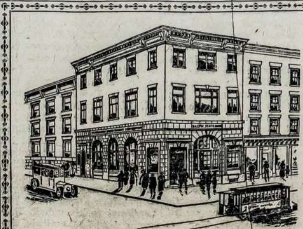
BALTIC STATES BANK Kapitalas ir Surplusas $270,000.00.

1614 W. 46-th St., Dept. 1 CHICAGO, ILL. P. S. Aušrai reikalingi yra agentai pardavinėjimui knygų, užrašinėjimui šerų ir t.t. Nušimtis gana geras. Del informacijų kreipkitės laišku Aušros Bendrovėn.