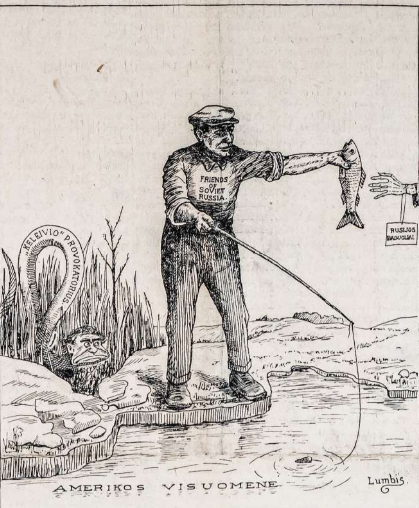
Kada susipratę Amerikos darbininkai renka aukas sušėlpimui Rusijos baduolių, tai "Keleivis", pasikvietęs talkon Geležėles, stengiasi tam darbu užkentki.

New Yorkas, geguž. 1. — Apie 5,000 duonkepių pasirengę streikuoti, jeigu nebus išpildyti jų reikalavimai. Kontraktas su kompanijomis pasibaigia su pirma diena gegužės mėnesio. Tačiau atnaujinimas jo nekeltas iki utarninko. Iki šiol darbininkai gaudavo se-