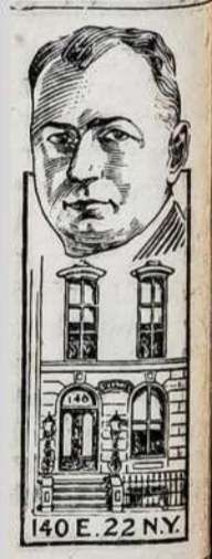
140 E. 22 NY.