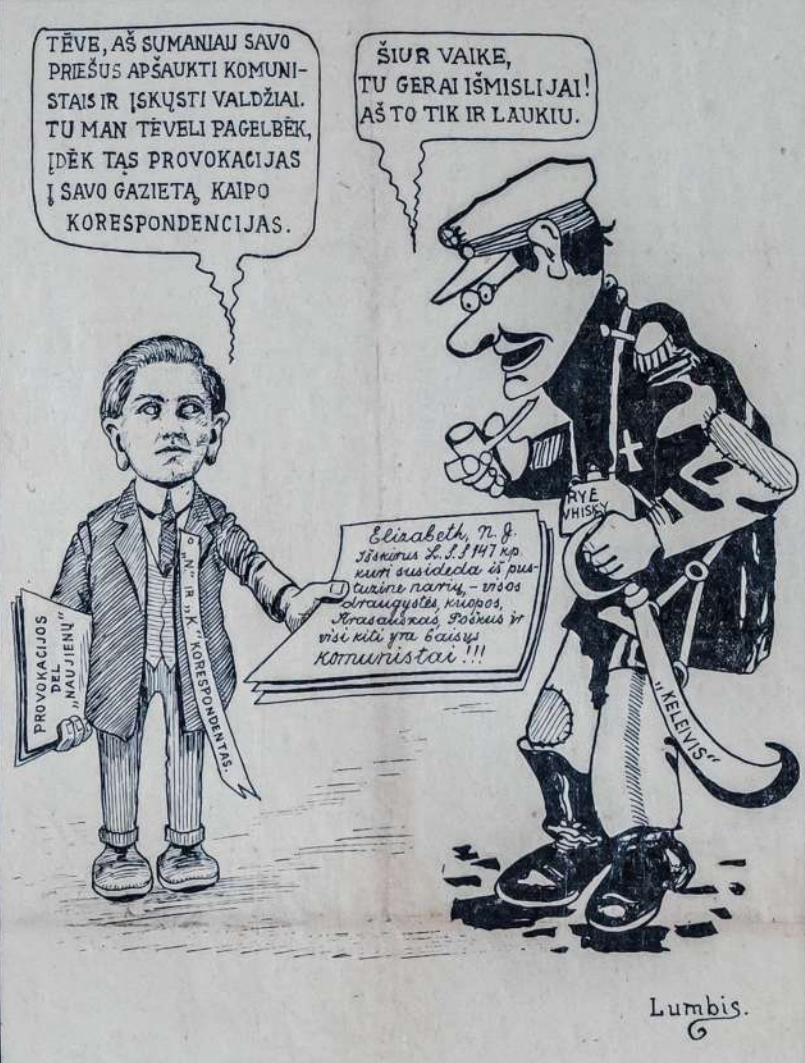
So. Bostono Bachmetjevo organo žinių agentūra.

giama pašto, telegrafo ir bevielinio telegrafo susinešimai. Abi pusės pasiima ant savęs atsakomybę už savo atstovų veikimus kitoje šalyje.