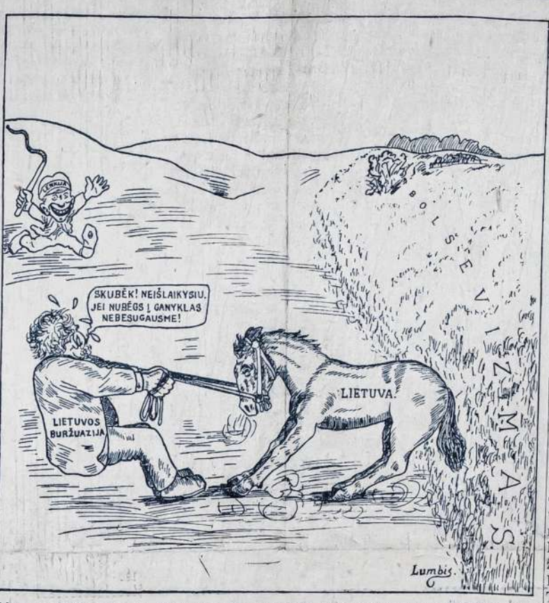
Lietuvos buržuazija, su lenkų pagalba, neleidžia Lietuvai jungtis su darbininkiška Rusija. Bet kažin ar ilai kys?

Sioux City, Iowa, 22 d. lapkričio. — Organizuoti ši- to miesto darbininkai pa- reiškė protestą Amerikos le- gionininkams ir taip vadina- miems Boy Scouts organiza- cijos nariams. Kuomet at- ėjo tam tikras atstovas kvieisti darbininkus į paro- dą, kuri buvo ruošama pa-