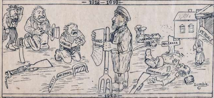
Rusijos proletariatas triumfuoja!

munijos valdžia bijosi savo kaimyniškų valstybių lygiai kaip revoliucijos šalies viduje.