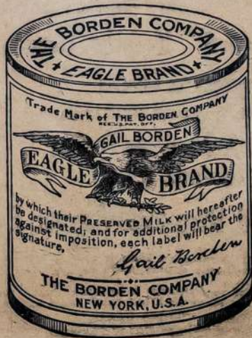
Borden's vardas ant kenuko "Pieno" yra lyginal kaip "Sterling" ant sidabro.

The Borden Company Borden Building, New York