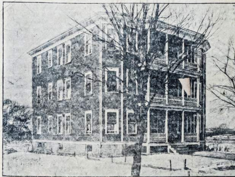
Kooperacijos nuosavas namas šešioms šėmynoms, su visais moderniškais įrengimais: Vertės $18,000.