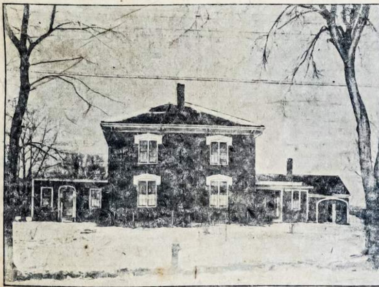
Keturių šėmynų nuosavas namas, vertės $8,000.

Nežiūrint kiek kas šėrų nusipirkty, turi tik vieną balsą, reiškia ypata balsuoja, o ne kapitalas. Dar vieną dalykėlį prašome, tai tėnykite į šį vaizbos ženklą, ir reikalaukite čeverykų su šiuo ženklū. Tuomi reikite darbininkų dirbtuvė. Taigi, nieko nelaukdamas, nusipirk šėrą (šėras $100.00) ir siųsk žemiau nurodytu vardu.