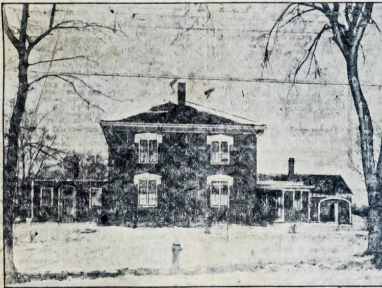
Keturių šeimynų nuosavas namas, vertės $8,000.

Nežiūrint kiek kas šėrų nusipirkty, turi tik vieną balsą, reiškia ypata balsuoja, o ne kapitalas. Dar vieną dalykėlį prašome, tai tēmykite į šį vaizbos ženklą, ir reikalaukite čeverykų su šiuo ženkle. Tuomi remsite darbininkų dirbtuvę. Taigi, nieko nelaukdamas, nusipirk šėrą (šėras $100.00) ir siųsk žemiau nurodytu vardu.