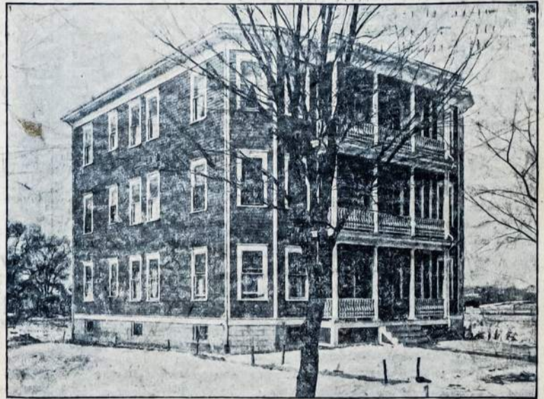
Kooperacijos nuosavas namas šešioms šeimynoms, su visais moderniškais įrengimais: Vertės $18,000.