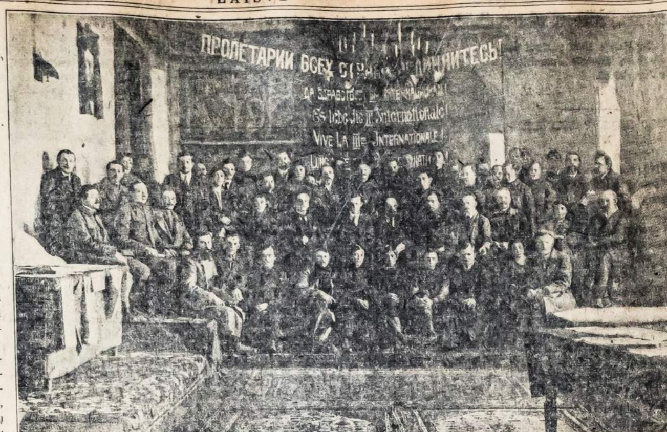
Делегаты первого съезда Коммунистического Интернационала в Москве (2-6 марта 1919 г.).

Pirmas III-jo Internacionalo Kongresas, įvykęs Maskvoje 1919 m., 2-6 dd. kovo.