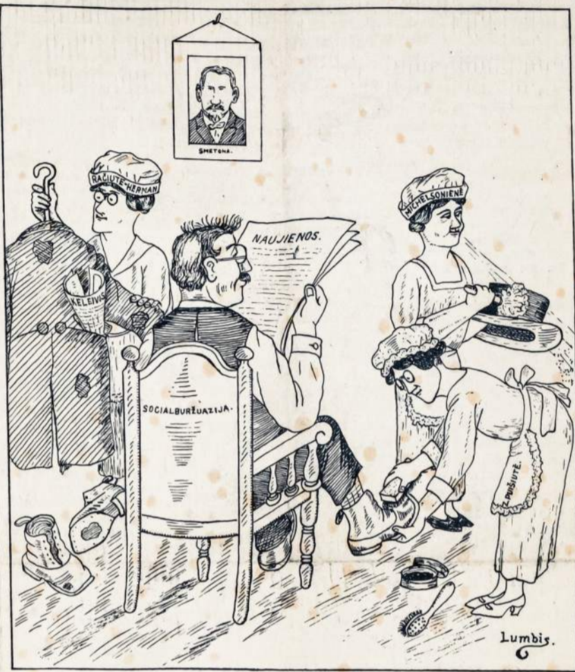
Gerbiamoji šeimynėlė rengia delegatą į smalvirių suvažiavimą.

True translation filed with the Postmaster of Brooklyn, N. Y., on November 27, 1919, as required by the Act of October 6, 1917. Taiga, Sibiras, 26 d. lapkričio. — Juodašimčių armijos aficerių 8,000 moterų ir vaikų po vienuolikos valandų bėgimo iš Omsko, tapo bolševikų paimti 10 mylių į rytus nuo Omsko. Užpakalinių Sibiro juodašimčių linijų pasitraukimas iš savo sostinio miesto buvo didžiausiam sumišime ir betvarkėje. Kareiviai metė šalin ginklus ir puolėsi prieš traukinių, lokomotyvų, ve-