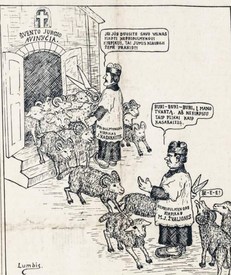
Kirpikai varžosi už vilnas.

Columbus, Ohio, 30 d. spa- lio. — Jeigu įvyktų anglies kasyklų streikas, kuris tapo apšauktas ant 1 d. lapkričio, tuomet vienoj Ohio valstijoj streikuos 40,000 darbininkų ir užsidarys 1,200 anglies kasyklų.