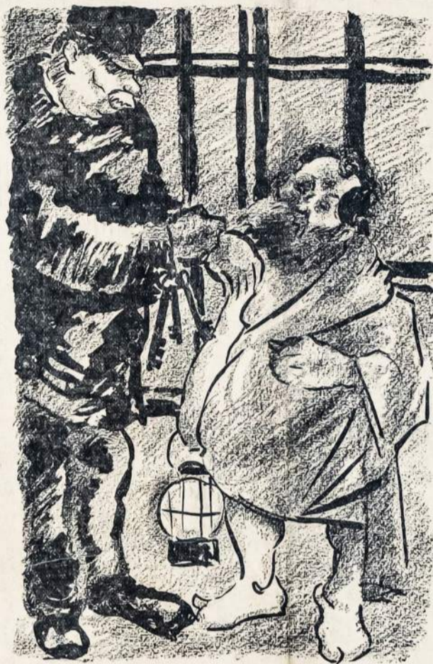
Surado teisingų žmonių buveinė. Dioneuzas: — Visur apėja uniekur nerandū teisingo žmogaus. Gal jūs žinote, kur galėčiau toki rasti? Kalėjimo sargas: — Jūs kaip tik pataikėte, kur ateiti. Eikit į vidų ir pasirinkite, čia visi teisingieji žmonės uždaryti.

Buffaloje, New Yorko valstijoje, trečia streiko diena valstijos kazokai raiti užpuolė ant streikierių minios, trypdami arkliais ir mušdami be skirtumo vyrus, moteris ir kūdikius. Vaikėsi bėgančius žmones, net į joms jodami su arkliais. Streikieriai gynėsi nuo užpuolikų akmenimis, bet, suprantama, negalėjo atsilaikyti. Šimtai žmonių baisiai sumušti.