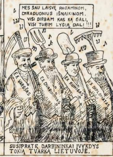
DVARININKAI IR KANDIDATAI Į BURŽUAZIJA NORI TOKIOS "LAISVĖS" LIETUVOJE.