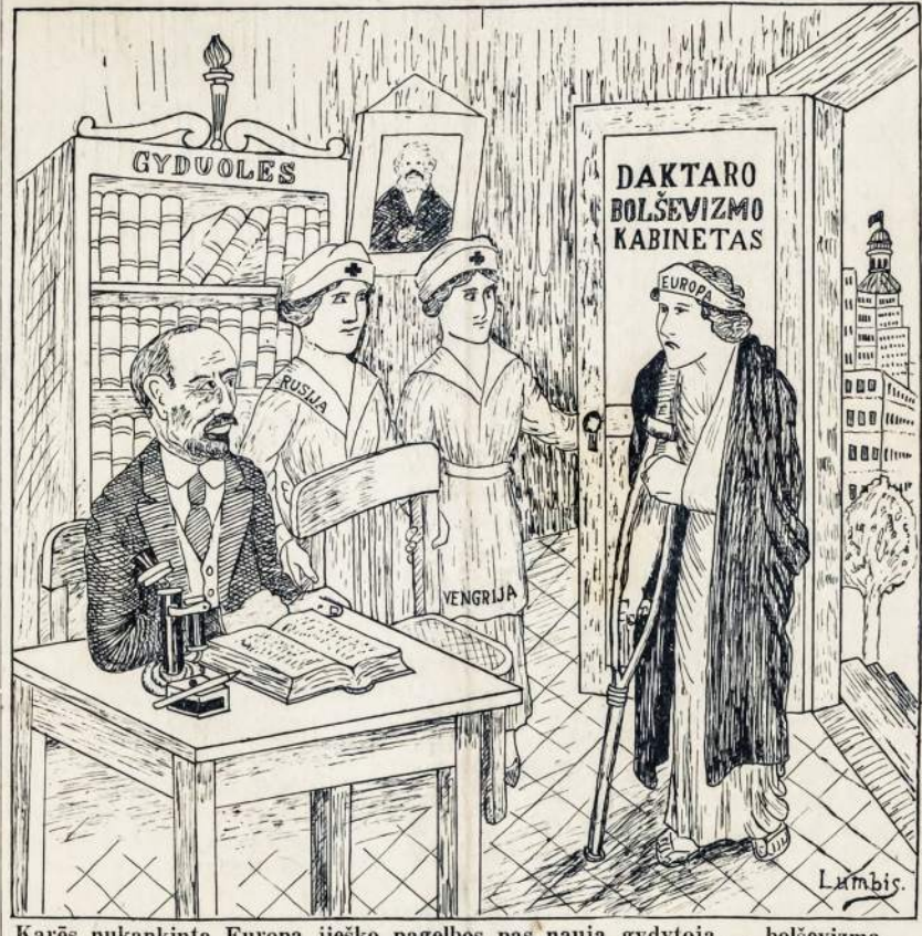
Karės nukankinta Europa įieško pagelbos pas naują gydytoją — bolševizmą.

Talkininkai siūnčia Budapestan 5,000 kareivių. True translation filed with the Postmaster of Brooklyn, N. Y., on August 7, 1919, as required by the Act of October 6, 1917. Berlynas, 5 d. rugp. — Iš Vienos praneša, kad nauja Vengrijos ministerija, kurią vadovavo Peidl, jau rezignavo, kadangi talkininkai nesutikę jos pripažinti. Pranešime sakoma, kad nauja ministerija būsianti suorganizuota iš darbininkų, piliečių ir valstiečių lyderių ir pirmutine jos pareiga bus "pertaityti" visus Tarybų valdžios išleistus įstatymus. Kiti iš Vienos gauti pranešimai skelbia, kad talkininkai skubiai siūnčia į Budapeštą 5,000 kareivių, kurių būk tai prašiusi naujoji Vengrijos valdžia. Karės ministeris sutikęs išpildyti rumunų generolo reikalavimą tuoj demobilizuoti ir nuginkluoti raudonąją armiją, paliekant tik 4,000 kareivių Budapešte ir 20,000 kareivių visoje Vengrijoje palaiminimui tvarkos.