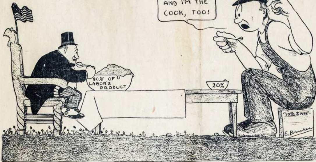
Kas pagamino, o kas valgo.

Iš Agramo gautuose pranešimuose nieko nesakoma apie kokias nors tame mieste buvusias riaušes. Tačiau sakoma, kad Agramo gauta žinių, jog daugely Kroatijos miestų kareiviai tą patį pa-