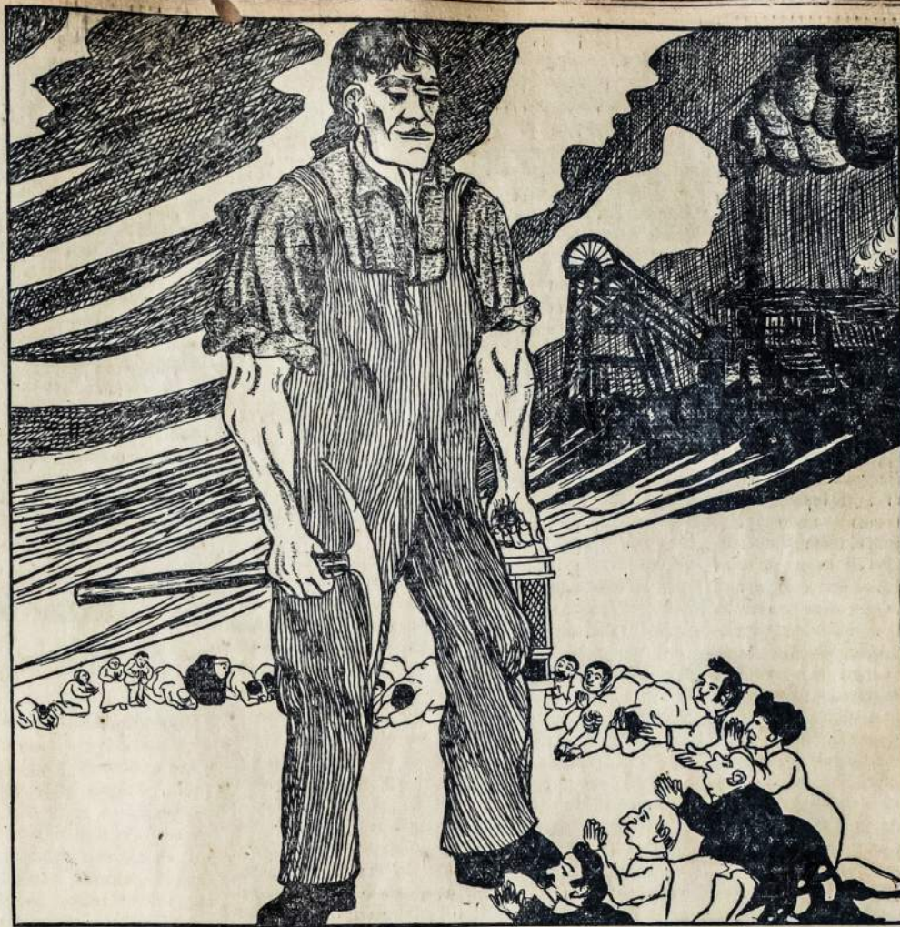
Sis paveikslėlis parodo, kas atsitinka, kuomet gerai susiorganizavę darbininkai apskelbia visuotiną streiką.

Pragaras visuomet buvo labai puikus dalykas kunigams ir visokiems pamokslininkams: — iš jo jie darė sau puikų gyvenimą.