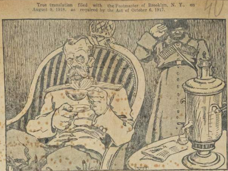
Kaip ant žemės, taip ir danguje.

Kaip dabar pasirodo, tai šgirdus paties tremtinio bal, są galima manyti, kad užnėtoji ant buvusių “šelpėjų” bausmė yra jais pačiais užsitarnauta.