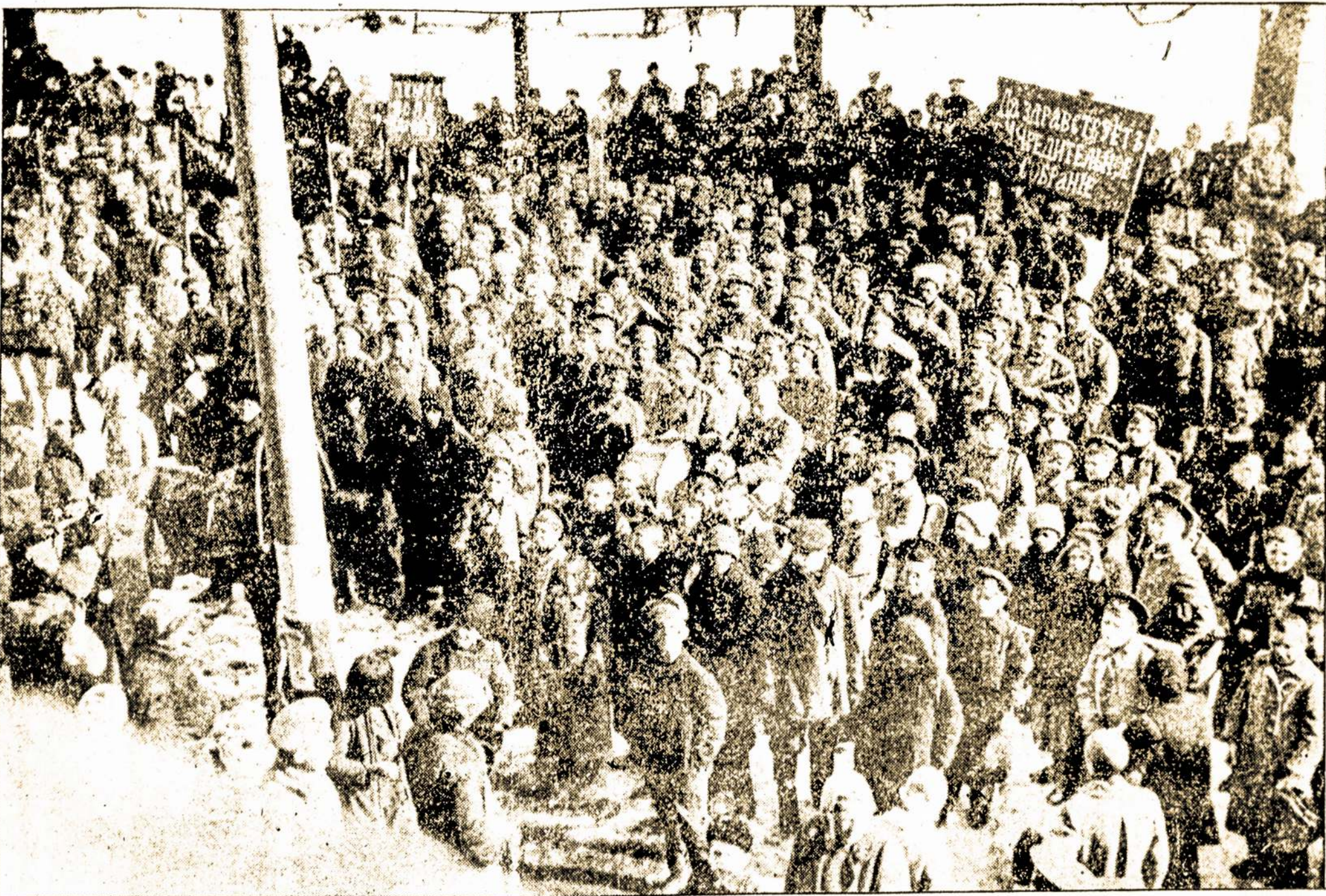
Rusijos revoliucionierių paroda.

Ignaca, Colorado. — Ute tautelės indijonai atsisakė registruoties. Visą dieną jie praleido šokiuose.