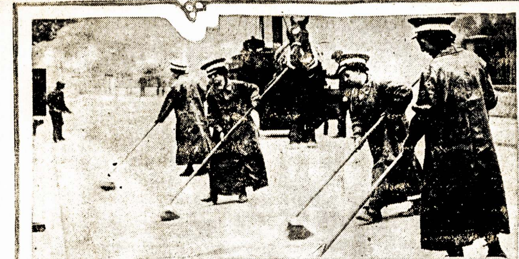
Anglijoj vyrai paimti į karę ir visus jų darbus atlieka moteris.