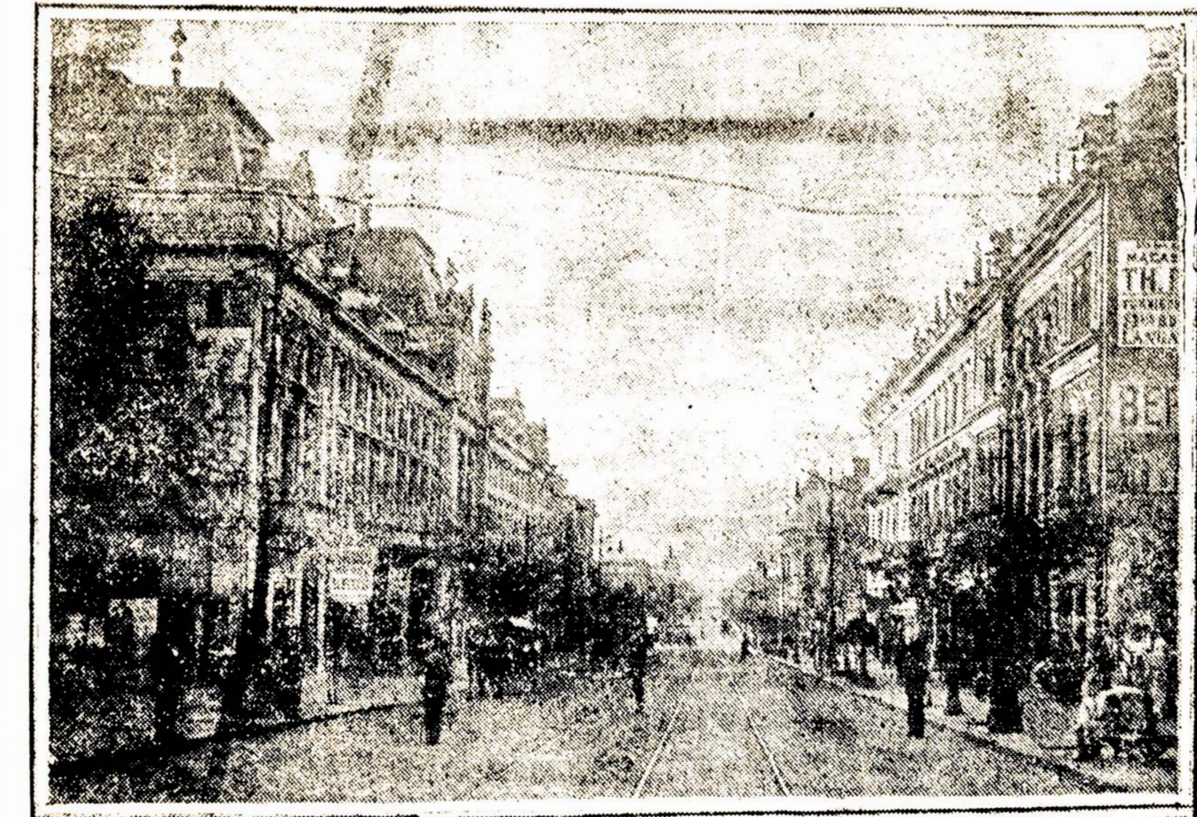
Rumunijos sostinė Bucharestas, kurį paėmė vokie- čiai. Bucharestas turi 400.000 gyventojų ir vadi- namas rytų Paryžium.

Teismo salėje e- nima latviškos- kaltininkai be- skaitymą ru- u laikraščiu ir obligatornių įsakymų nesilaikymą.