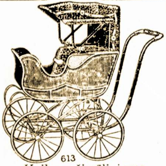
613 Vaikų vežimėliai nuo $1.98 iki $35.60.