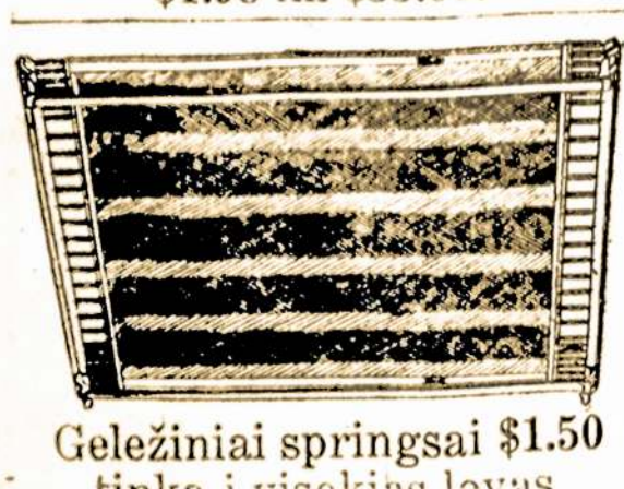
Geležiniai springai $1.50 tinka į visokias lovas.

Labai gero, storo stiklo veidrodžius augštas ir gražus už $7.95.