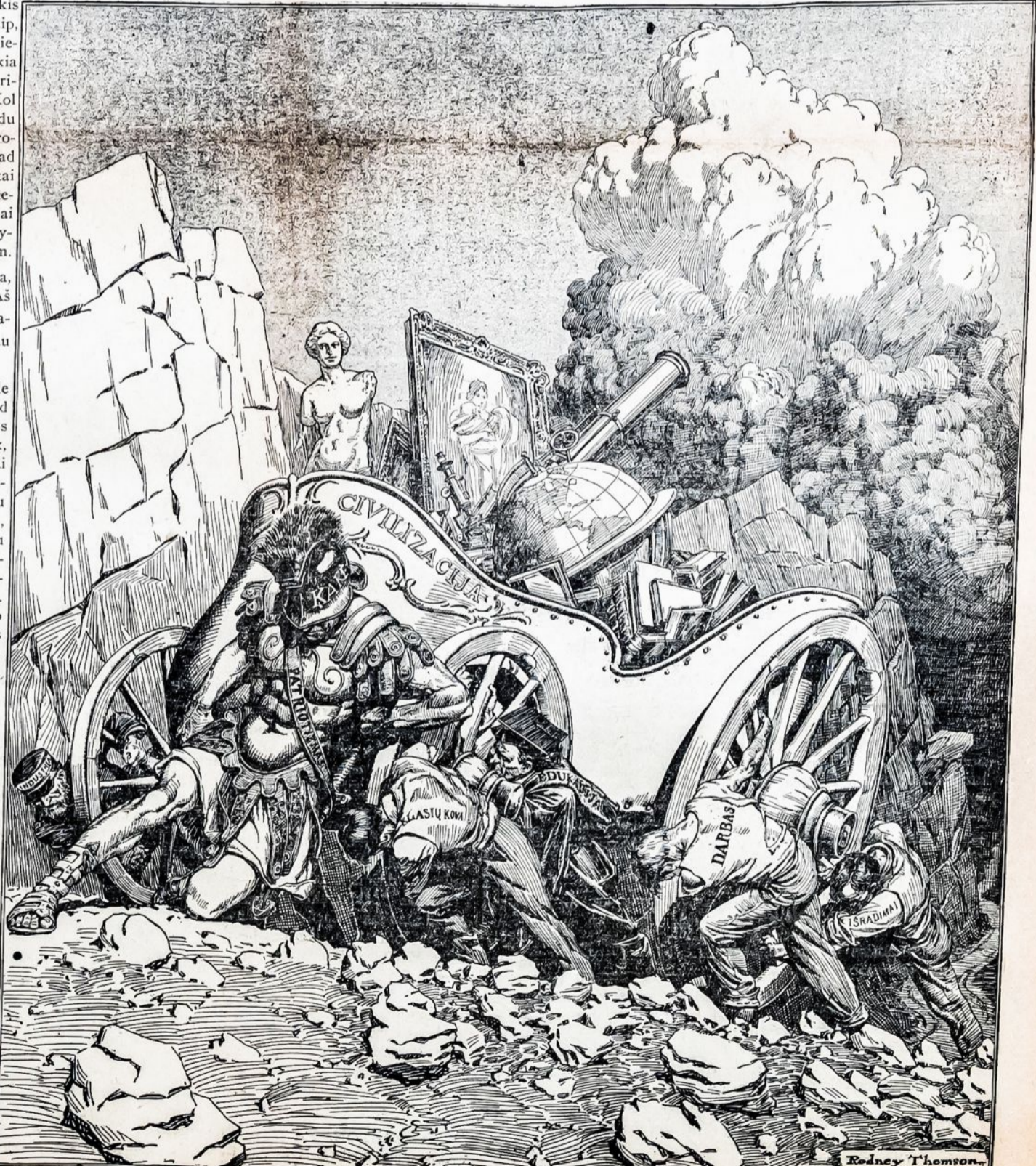
KAS STUMIA PIRMYN CIVILIZACIJOS VEŽIMĄ SU JO TURTAIS IR KAS JI SULAIKO?