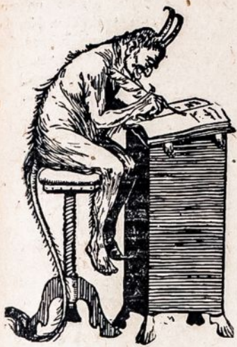
LIETUVIŲ TAUTA PRAZUVO.

Visa lietuviška visuomenė iškydo, visa pasidarė partvyška ir