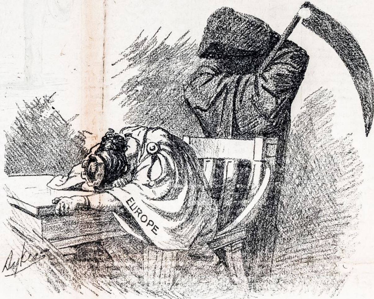
NELAIMINGOJI EUROPA. Negana, kad karės giltinė nepaliauja savo kruvinos pjutės, dar ir gamtinės katastrofos prigelbsti naikinti Europos žmones. Didelis žemės drebejimas nuliudino visą Italiją.

N 2 "Kovos" per klaidinančias informacijas, gautas iš Brooklyn, N. Y., tilpo neteisingas pranešimas, buk "Vienybė Lietuvių" bankrutijanti ir einanti ant licitacijos. Siuomi atšaukiamė tą klaidingą žinią. "Kovos" Redakcija.