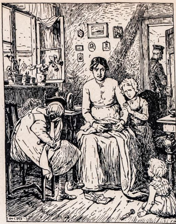
Ten mūsų sesutės aplėistosios laukia žinios nuo savųjų... — tik ašaras braukia.

Caro bernas vienu savo plunksnos brožu "paliuosavo" rutėnus nuo viso jų apšvietimo darbo, panaikino rutėnų literatūrą ir mokslą, uždarė skaityklas ir knygynus, panašiai kaip Muravjovas-korikas lietuviams padarė. Žinoma yra, kad visa rutėnų literatūra galėjo liuosai kilti ir plėtoties tik Galicijoje. Ukrainos kultura tokioju būdu dabar likosi sutrempta koja cariškojo berno. Bobrinskij, kaip tik ir primena mums mūsų liu-