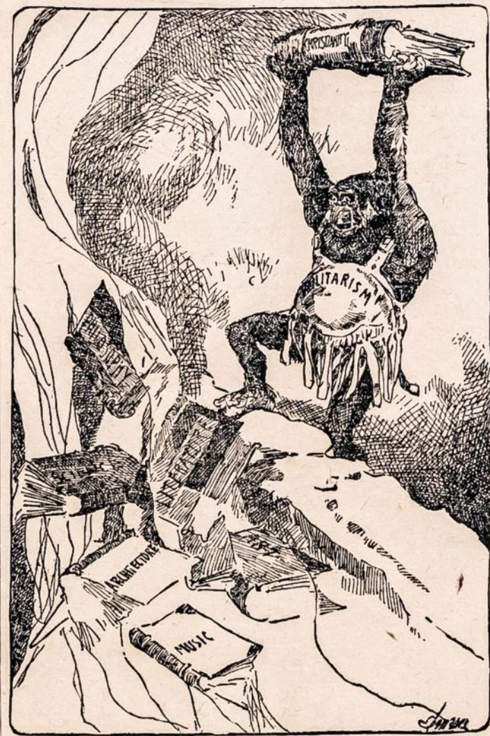
KARĖ NAIKINANTI MOKSLO NUVEIKIMUS.

(Tiek sako telegrama pas-kelbta Anglijos laikraštyje "The Daily Chronicle". Pridu-riama, kad kaizerio agentai stengiasi atskirti Franciją nuo talkininkų. Ar ištikrųjų vokie-čių socialdemokratai išleido tą atsišaukimą ir ar minėto laikra-ščio korespondentas juos vadina "kaizerio agentais" — telegra-moje nieko nesakoma).