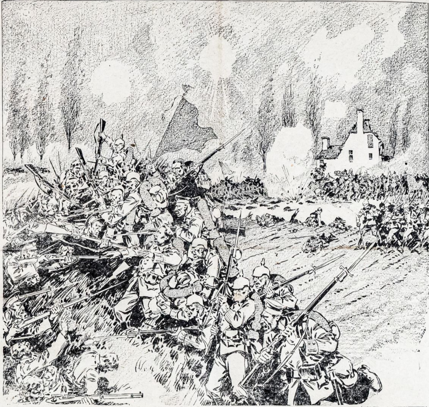
VOKIEČIAI ATMUSA IS RUSŲ ŠIRVINTĄ.

Londonas, 15 spalio. — Pranešama į čionai, kad persai, sykiu su kurdais ir turkais užpuola ant rusų parubežyje ir degina Rusijos sodybas. Pirmą susirėmimą su caro kariuomene kurdai laimėjo, užmušdami 50 maskolių, 3 oficerius ir paėmė 2 kanuoli. Susirėmimai tolesniai tęsiasi.