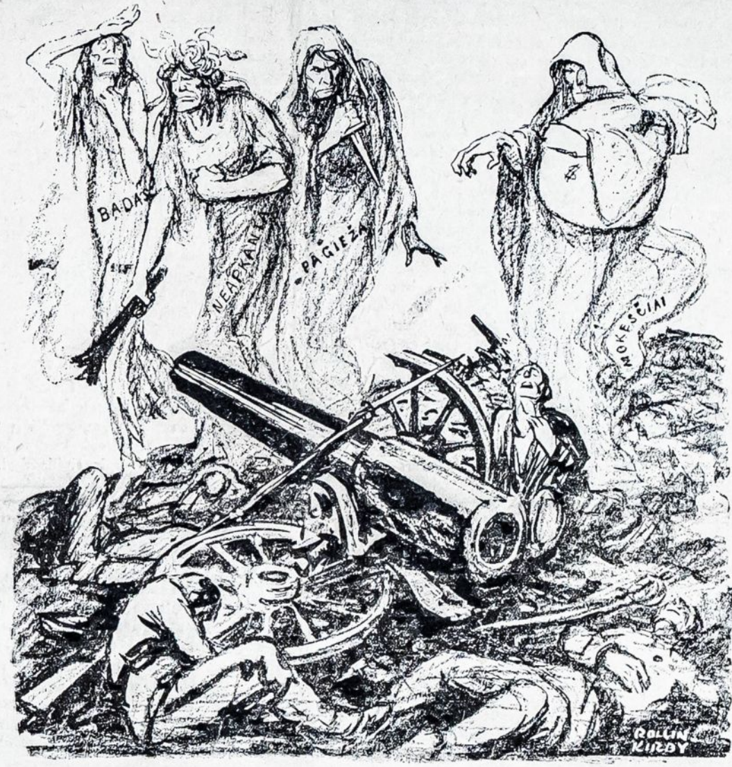
KARĖ IR JOS PASEKMĖS.

SERBAI SUMUŠTI. Amsterdam, 3 spalio. — Valdiškoji telegrama iš Viennos užginčija visus pranešimus apie serbų pergales ant austrų armijos. Austrijos kariuomenė sako, netik laiko visas savo pozicijas rytų link nuo upės Drinos, bet da sutvirtėjo, kada po kelių susirėmimų atmušė priešą. Serbų pastangos pereiti upę Sava